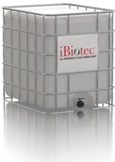
Kontejner GRV 1000 L